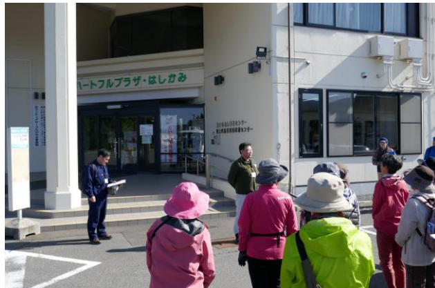
開講式の様子です。（所長あいさつ）