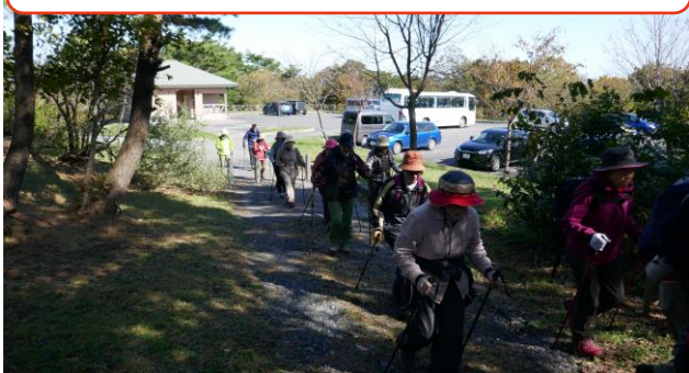
2班に分かれて登山開始です。