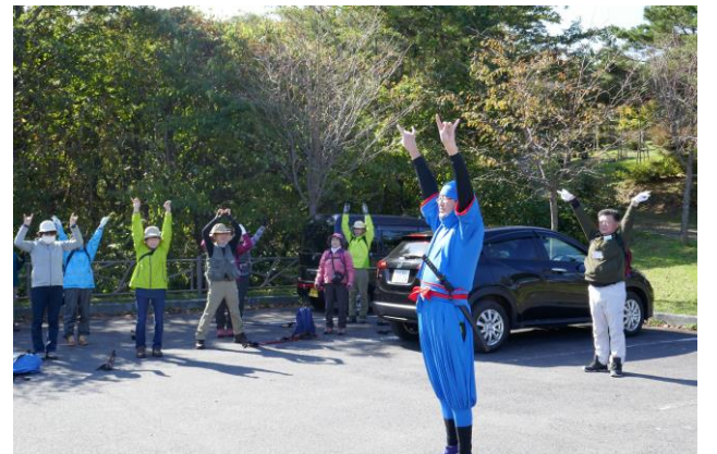
山頂への登山の前に、皆で楽しい準備運動をしました。