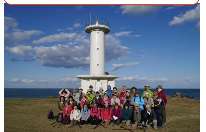
階上灯台で最後の記念写真です。参加者の皆様、今日1日本当にお疲れ様でした。